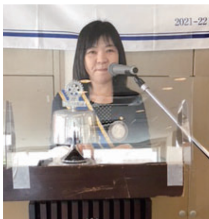
会長代理あいさつ 水庫会員