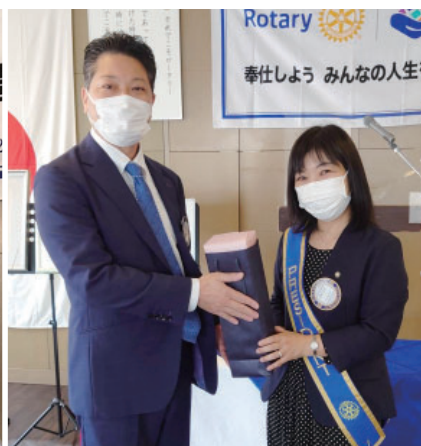
奥様誕生日 長野会員